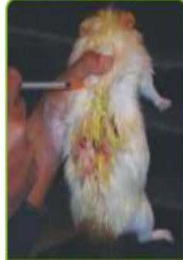
Aplicación subcutánea de medicamento