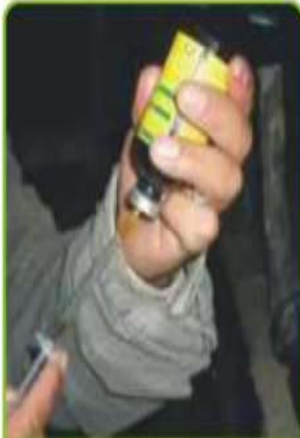
Cargado de aplicación a la jeringa