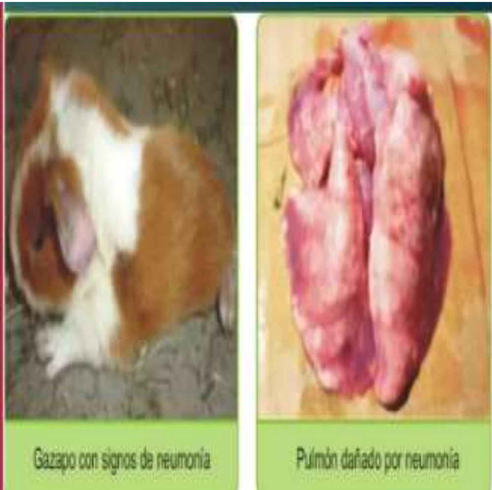
Gazapo con signos de neumonía