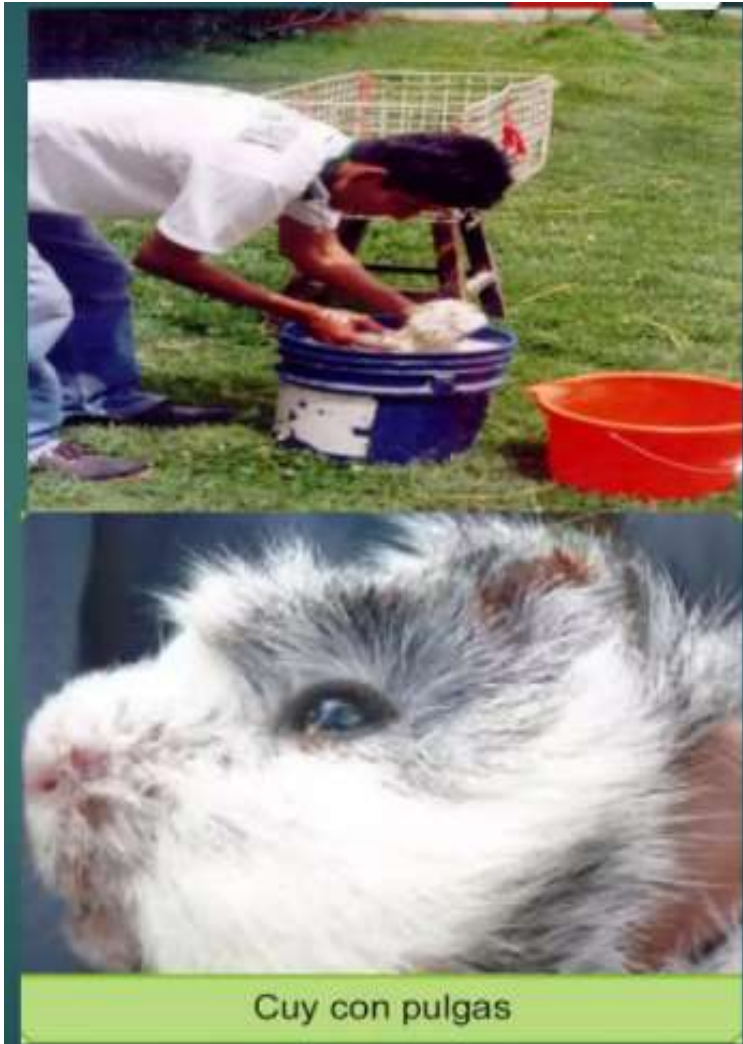
Cuy con pulgas